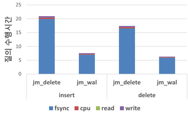
(그림 4) 1000 개의 INSERT 질의 수행시간 및 1000 개의 DELETE 질의 수행시간

그림 4 는 INSERT 와 DELETE 질의의 수행 시간 및 각 연산의 수행시간을 나타낸다. jm_delete 는 저널모드가 DELETE 일 때의 실험을 나타내고 jm_wal 은 저널모드가 WAL 일 때의 실험 결과를 나타낸다.